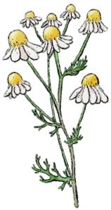
De la camomille (15 pts)

Note aussi où tu les as aperçus. Récolte les 100 points!