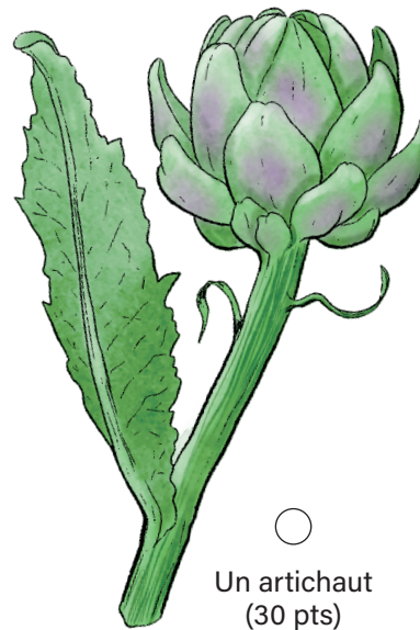
Un artichaut (30 pts)